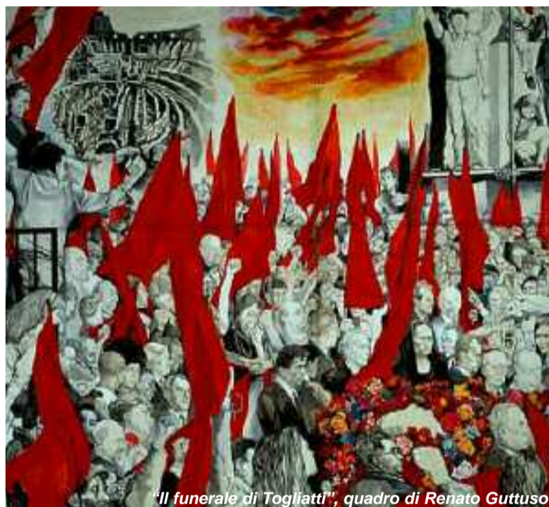
"Il funerale di Togliatti", quadro di Renato Guttuso