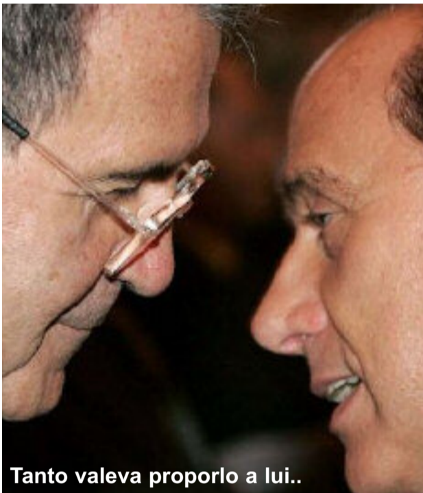
Tanto valeva proporlo a lui..